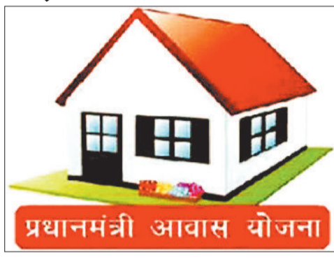
आवास योजना के तहत ऐसे गरीब परिवारों को घर मुहैया कराया जा रहा है, जिनका सामाजिक एवं आर्थिक जनगणना 2011 की

मुख्यमंत्री विष्णुदेव साय की अध्यक्षता में विगत दिनों आयोजित कैबिनेट की प्रथम बैठक में राज्य के ग्रामीण अंचल के आवासहीन के लिए अहम फैसला लिया गया। राज्य में 18 लाख 12 हजार 743 जरूरतमंद परिवारों को तत्परता से आवास की स्वीकृति देने के साथ ही आवश्यक धनराशि उपलब्ध कराई जाएगी। जशपुर जिले में 30 हजार से अधिक परिवारों को भी इसका जल्द लाभ मिलेगा। जिले में प्रधानमंत्री आवास योजना से गरीब तबके के लोगों का अपना पक्का मकान बनाने का सपना साकार हो रहा है। जिन परिवारों को पूर्व में राशि नहीं मिली एवं जिन परिवारों का आवास के लिए स्वीकृति हो गई उन्हें जल्द ही निर्माण की मंजूरी देने के साथ ही राशि उपलब्ध कराई जाएगी। प्रधानमंत्री