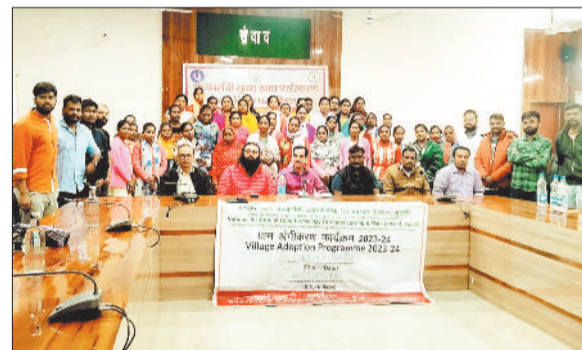
आत्मनिर्भर बन रही महिलाएं।

जशपुर की महिलाएं पीएमएफएमई योजना के माध्यम से खाद्य प्रसंस्करण क्रांति में अग्रणी बन रही हैं। आत्मनिर्भरता की दिशा में आगे